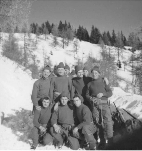
22 gennaio 1974 Monte Cavallo (Bz)

I Sessanta se ne sono andati e i Settanta si bruciano troppo in fretta. Il servizio militare diventa uno spaventoso spartiacque che lascia indietro tante cose della mia vita e anche della mia musica. Insomma, la vita, come la musica non è ormai più la stessa e anch'io non sono più lo stesso. Nonostante ciò la poesia e la musica rimangono, per me, pagine irrinunciabili come le speranze ed i sogni che mi porto sempre con me. Dimentico in fretta la naja (bruttissima!) e cerco di rimettermi in moto. Il lavoro non dà grandi soddisfazioni ed il mio cuore è nuovamente "ferito e sanguinante".